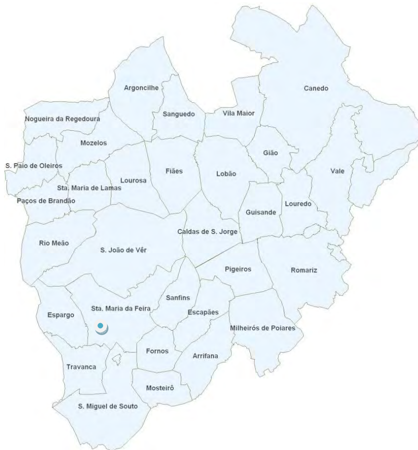
Agrupamento de Escolas Fernando Pessoa