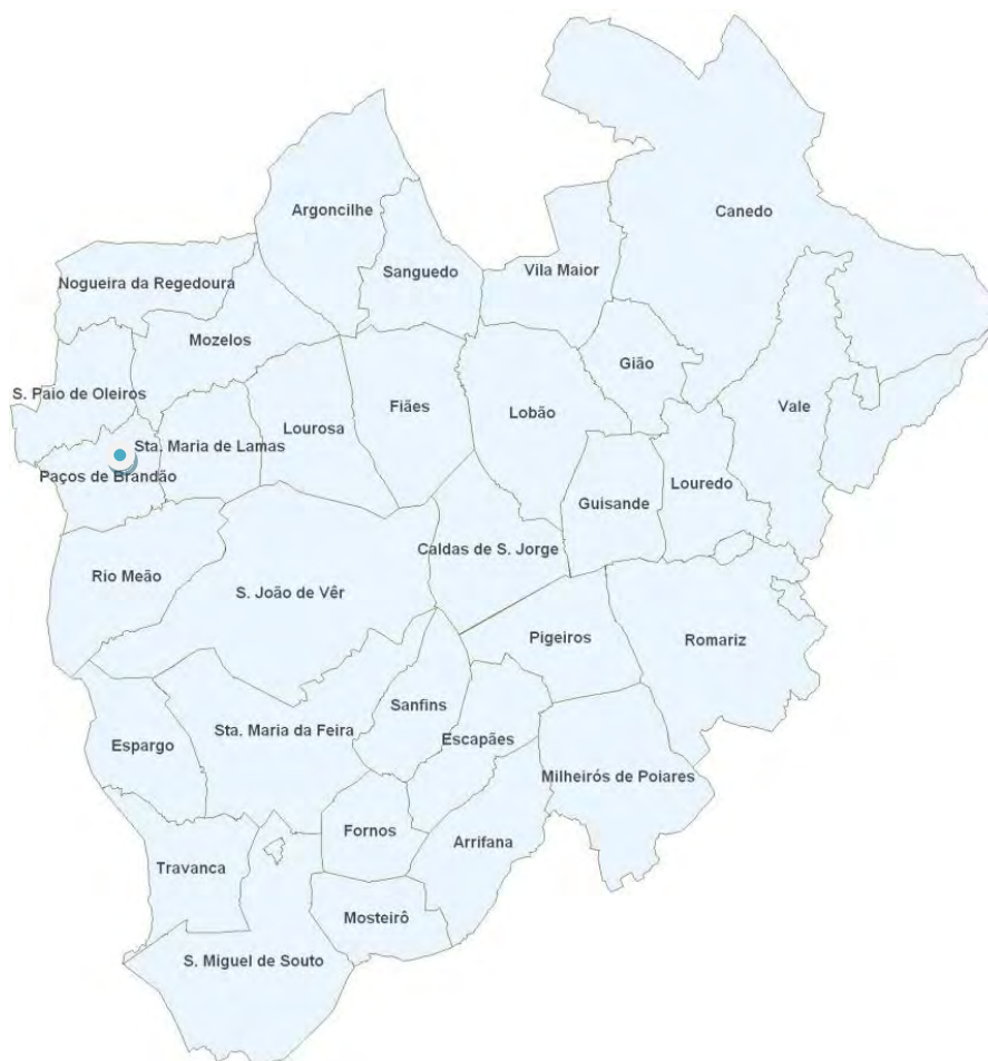
Agrupamento de Escolas de Paços de Brandão